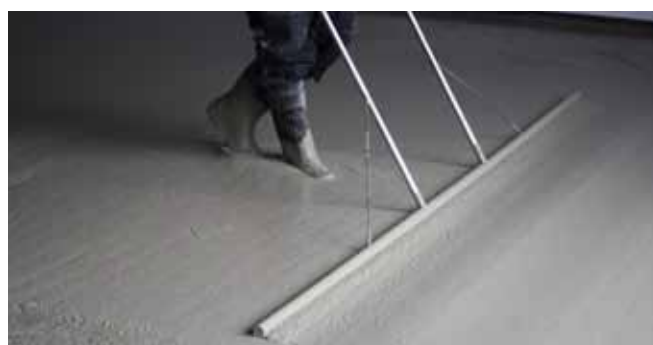
■ CEMFLOW® - realizace lité podlahy